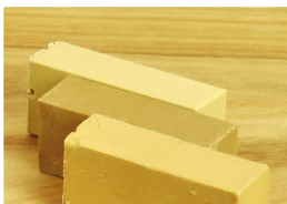
2 Farben wählen

Die zu reparierende Schadstelle muss sauber, trocken und fettfrei sein. Eventuell lose, abstehende Teile vor der Reparatur entfernen.