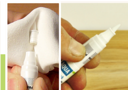
9 Stift entlüften

Bevor Sie mit dem Stift eine Versiegelung vornehmen, bitte den Stift ca. 15 Sek. schütteln. Die Rührkugeln müssen dabei hörbar sein. Danach die Kappe des Stiftes abnehmen.