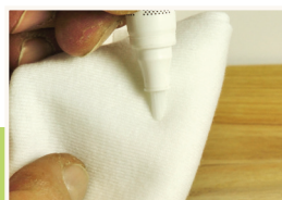
10 Stift aktivieren

Zur Feinabstimmung nun die Maserung mit einem dunkleren Füllstoff nachahmen. Danach die Überstände wieder mit den Hobelrillen abtragen.