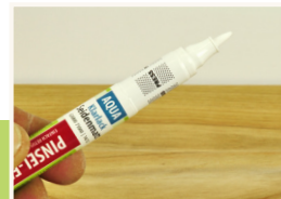
8 Stift schütteln

Verbleibende Füllstoffreste mit dem Schleifpapier verschleifen. Dazu mit dem groben Schleifpapier (150) beginnen und dann zur feineren Körnung (240) wechseln. Hinweis: Vorsichtig und nur mit leichtem Druck über die Oberfläche schleifen.